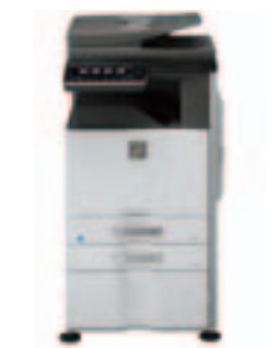
MX-2640N Basisgerät Inneres Ausgabefach Konsole mit 500-Blatt-Papierkassette