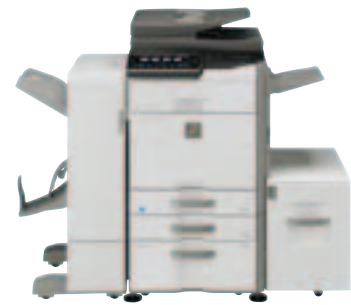
MX-3640N Basisgerät Konsole mit 500- und 2.000-Blatt-Papierkassetten Finisher mit Sattelheftung + Papierführung Ausgabefach Großraummagazin