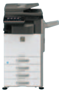
MX-3140N Basisgerät Finisher Konsole mit 3 x 500-Blatt-Papierkassetten Ausgabefach